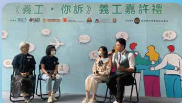
賽馬會青少年情緒健康網上支援平台 <義工·你訴>義工嘉許禮，表揚義工的付出。