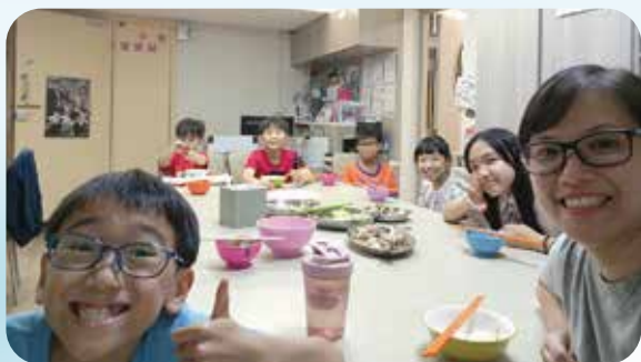
一家大小樂在晚膳。