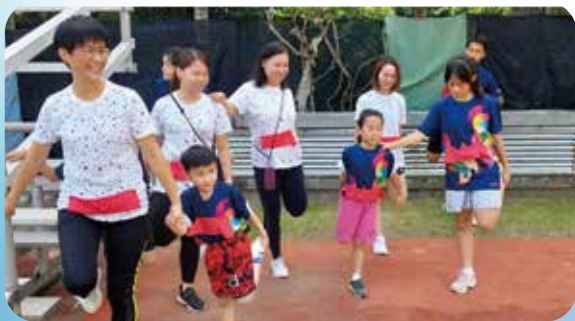
職員和舍童一同起動。