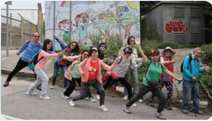
照顧者減壓活動 - 行山。