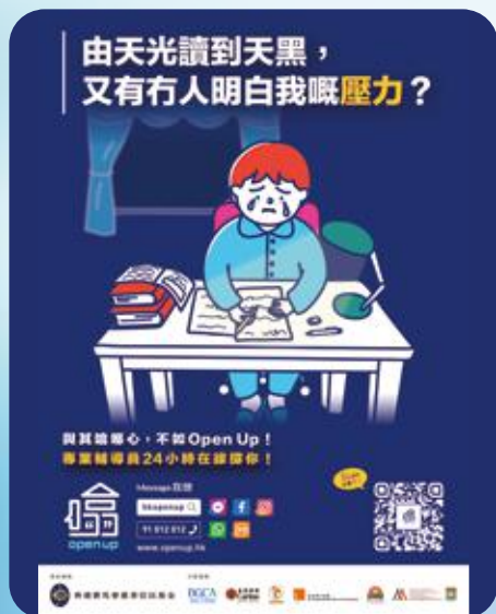
賽馬會青少年情緒健康網上支援平台（Open 喻）海報。