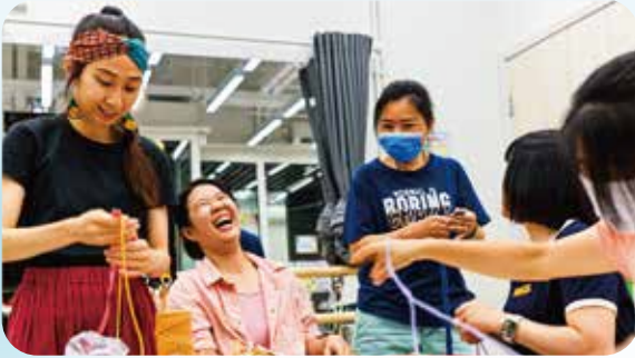
街坊於鄰里客廳學習編織捕夢網，享受鄰里友好關係。