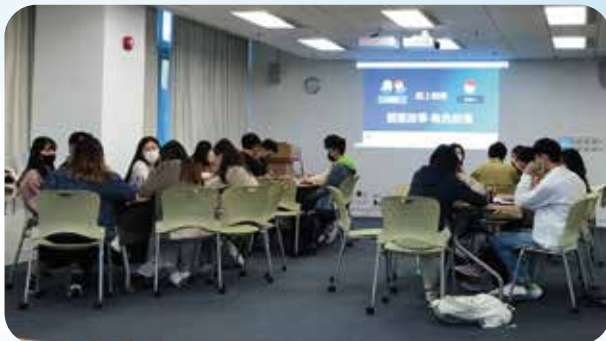
計劃為義工提供服務前專業培訓，掌握網上輔導技巧。