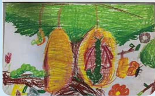
透過治療小組兒童重建正向成長的信心和希望。