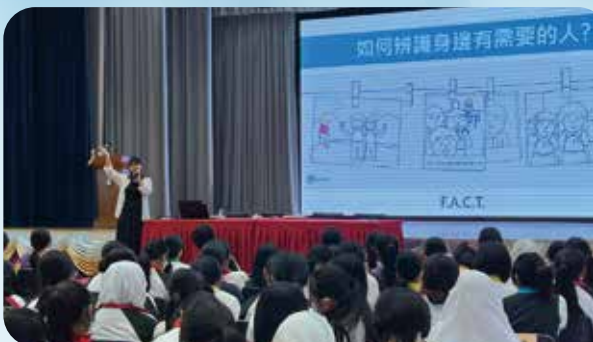
計劃到訪中學及大專院校，進行入校宣傳及社區心理健康教育工作。