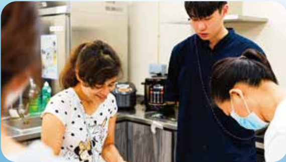
街坊於鄰里飯廳一起烹飪，分享健康食譜。