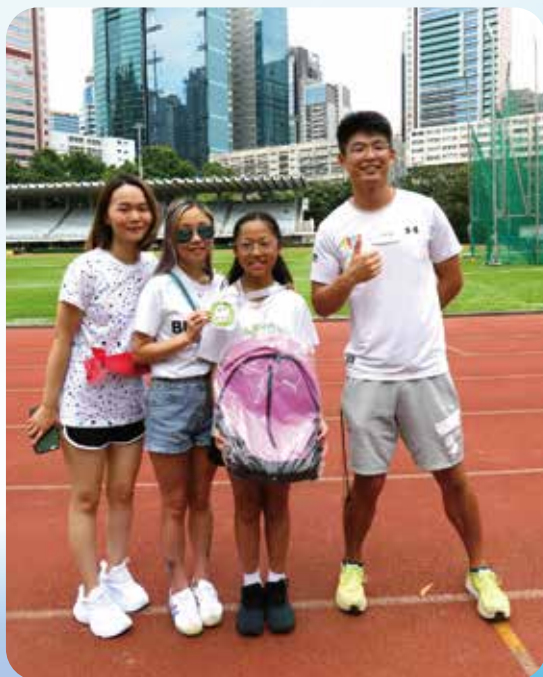
家舍和家人一起支持兒童發展。