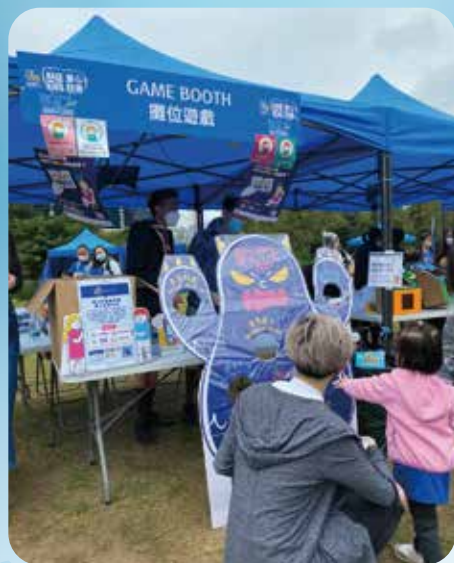
透過攤位活動，讓大眾認識更多負面情緒及初步了解負面情緒的舒緩方式。