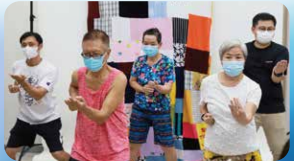
街坊於家庭保健房一起做運動，建立健康生活習慣。