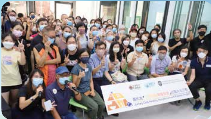
計劃團隊、街坊、持份者大合照。