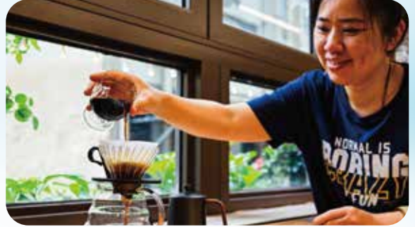
街坊於鄰里客廳體驗手沖咖啡。