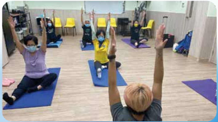
照顧者減壓活動 - 瑜珈。