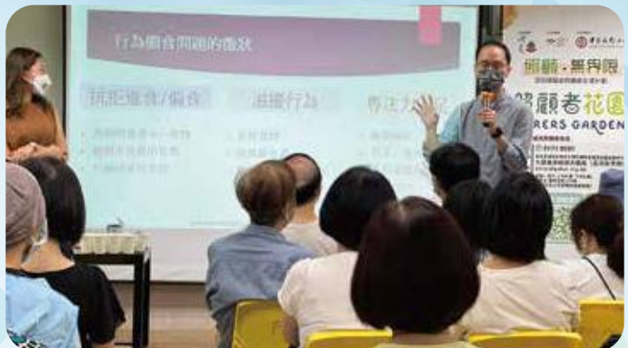
預防吞嚥困難講座。