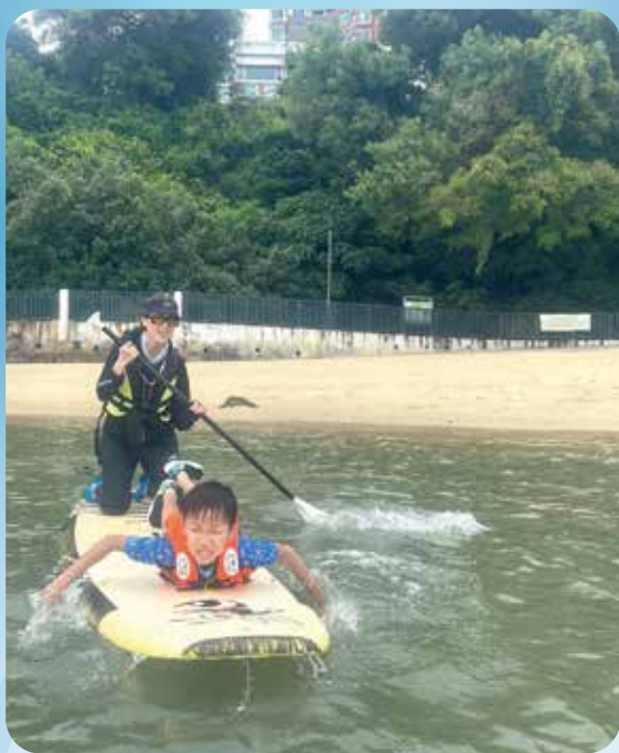
姨姨為孩子加添前進的動力。